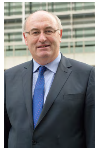
M. Phil Hogan, Commissaire européen à l'agriculture et au développement rural

Cette conférence fait suite aux précédentes conférences annuelles fi-compass dédiées aux instruments financiers mobilisant du FEADER qui ont eu lieu à Dublin en 2015 et à Bruxelles en 2016 ainsi qu'aux six conférences macro-régionales qui se sont déroulées à Vienne en 2015, à Riga en 2015, à Madrid en 2016, à Rome en 2016, à Varsovie en 2016 et à Tallin en 2017.