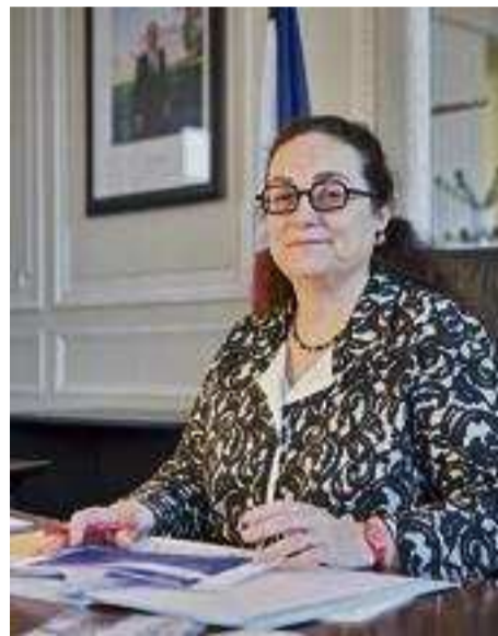
ERASMUS + FRANCE

Les universités, les établissements scolaires, les centres d'apprentissage ou encore les lycées professionnels sont au cœur du programme. Ce sont eux qui construisent